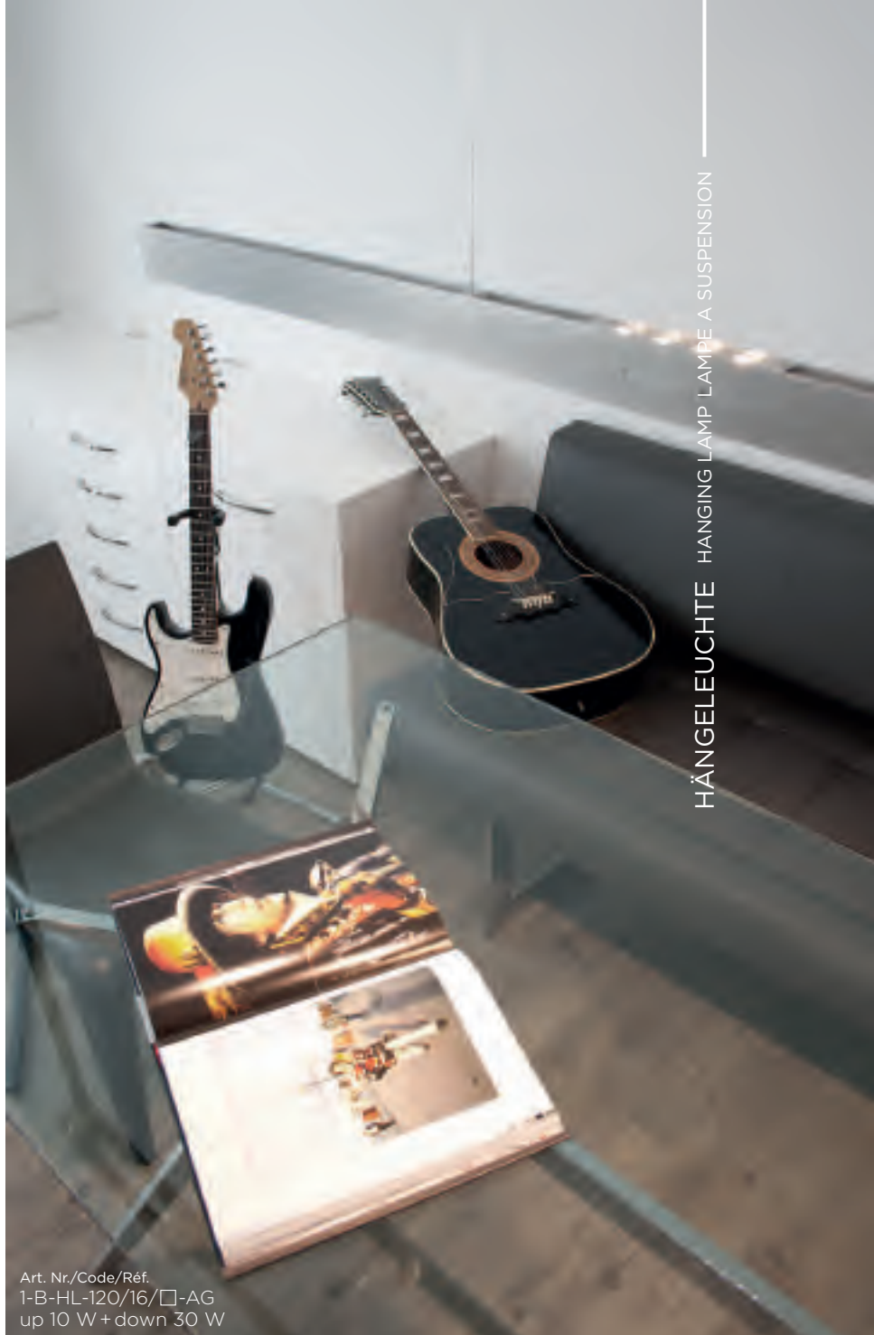
HÄNGELEUCHE HANGING LAMP LAMPE A SUSPENSION

Abmessungen/dimensions/dimensions L 1200 x B 30 x H 50 mm L 1700 x B 30 x H 50 mm Kabellänge/cable length/longueur du cable 1600 mm standard Netzspannung/main voltage/tension 100-240 V/50-60 Hz Leistung/wattage/puissance Mod. 120/12 (30 W downlight, 10 W uplight) Mod. 170/16 (40 W downlight, 10 W uplight) Mod. 170/20 (40 W downlight, 10 W uplight) Dimmbar/dimmable/dimmable Sensor sensor/capteur Sensorbereich/sensor distance/distance de capteur ca. 70 mm Schutzklasse/protection class/class de protection IP 20 Leuchtmittel/lightsource/source de lumière Power LED (CREE) (driver incl.) Abstrahlwinkel/beam angle/angle de faisceau 120° Farbtemperatur/color temp./temp. couleur ca. 2700 K/3000 K Farbwiedergabe/color index/indice de couleur Ra > 90 Effizienz/efficiency/efficience 75 Lumen/W Lichtstrom/luminous flux/flux lumineux 2250 Lumen (Mod. 120/12) 3000 Lumen (Mod. 120/16) 3000 Lumen (Mod. 170/16) 3750 Lumen (Mod. 170/20) LED mittl. Lebensdauer/av. lifespan LED/vie moyenne LED 30.000 Std. Gesamtgewicht/total weight/poids total ca. 4 kg