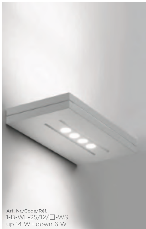
Art. Nr./Code/Réf. 1-B-WL-25/12/□-WS up 14 W + down 6 W