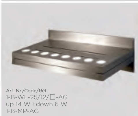
Art. Nr./Code/Réf. 1-B-WL-25/12/□-AG up 14 W + down 6 W 1-B-MP-AG